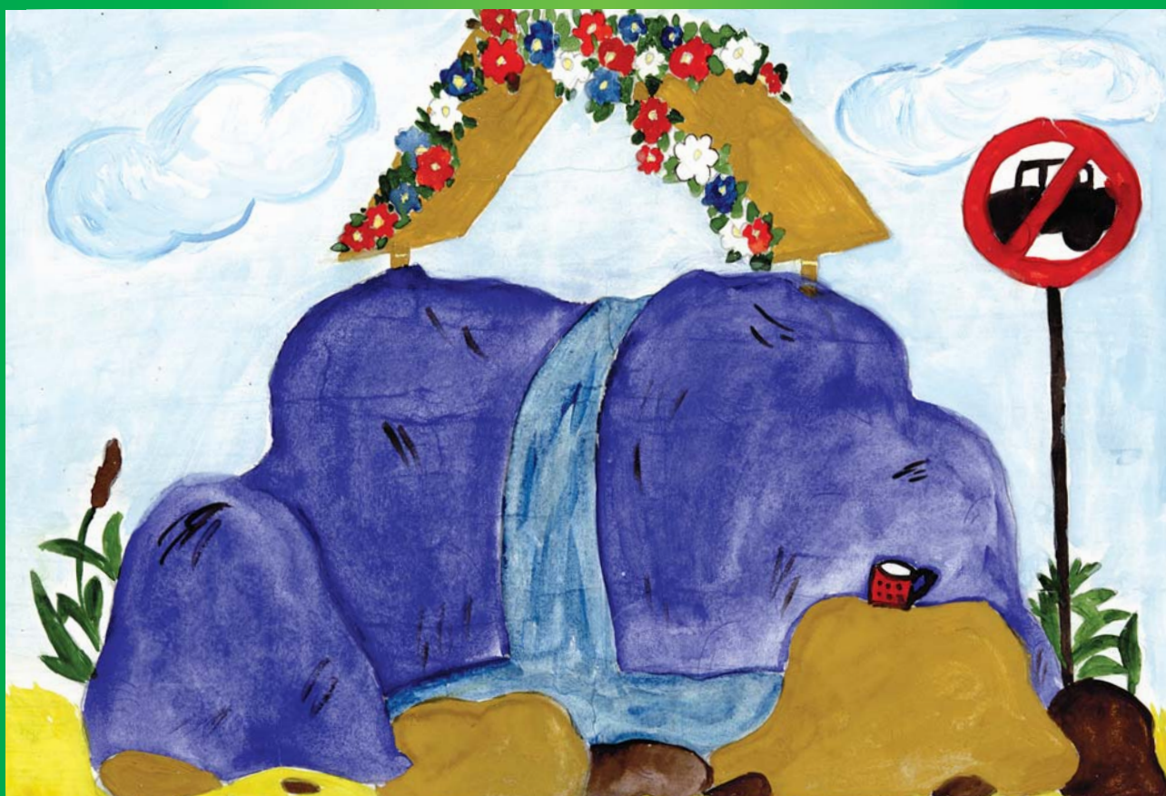
Рисунок учащейся МКОУ СОШ с. Новоселовка Екатериновского муниципального района Саратовской области Мазурык Светланы

В радиусе ближе 20 м от родника не допускается мытье автомашин, водопой животных, стирка и полоскание белья, а также осуществление других видов деятельности, способствующих загрязнению воды.