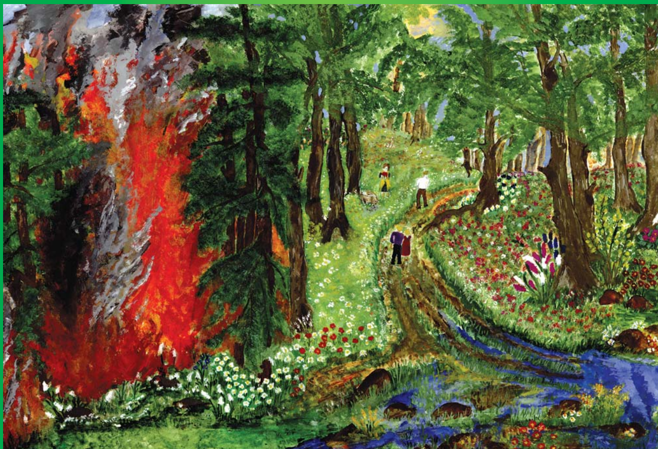
Рисунок учащейся МБОУ СОШ №12 Энгельсского муниципального района Саратовской области Семёновой Алины

Если в данной местности введен особый противопожарный режим, пребывание граждан в лесах может быть ограничено в целях обеспечения пожарной безопасности в лесах в порядке, установленном Министерством природных ресурсов и экологии Российской Федерации.